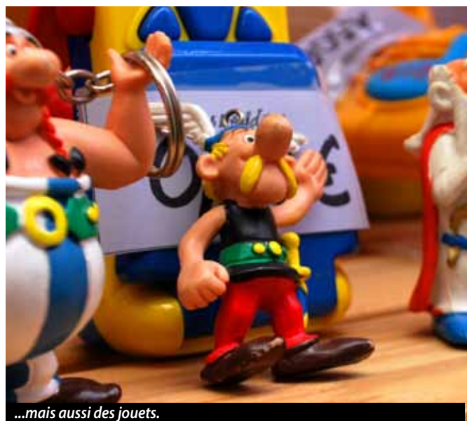
...mais aussi des jouets.